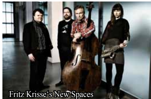
Fritz Kresse's New Spaces

In der internationalen Kontrabass-Szene ist Fritz Kresse seit Jahrzehnten eine Galionsfigur der Integration klassischer Spieltechniken mit den Möglichkeiten des modernen Jazzbassisten. Die Fähigkeit, sich gleichstark in den verschiedensten Stilen der Musik auszudrücken, macht Kresse zu einem der führenden Virtuosen seines Fachs. Am 6. Juli präsentiert Kresse sein neues Quartett: NEW SPACES. Ein neuer Sound, eingebettet in den Klängen eines E-Pianos, profiliert durch den zusätzlichen Einsatz des Altsaxophons und abgerundet mit den satten Grooves eines Jazzdrummers, der auch in der afro-kubanischen Musik zuhause ist.